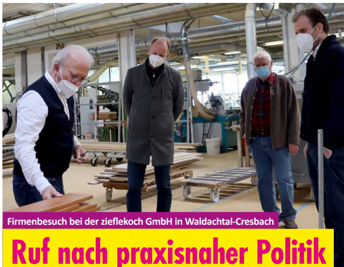
Firmenbesuch bei der zieflekoeh GmbH in Waldachtal-Cresbach