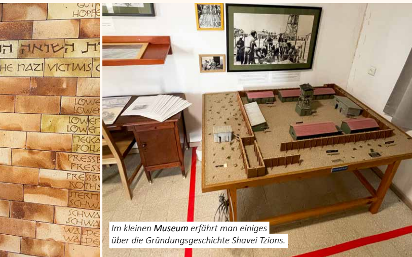
Im kleinen Museum erfährt man einiges über die Gründungsgeschichte Shavei Tzi- ons.