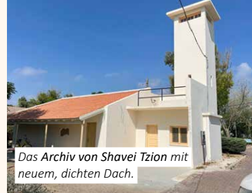
Das Archiv von Shavei Zion mit neuem, dichten Dach.

Rexingen sind eng miteinander ver- bunden und mich freut es, dass wir es gemeinsam geschafft haben, durch die finanzielle Förderung des Archivs diese besondere Verknüpfung zu stär- ken. Beide Orte und ihre Geschichte liegen mir persönlich am Herzen, weshalb ich mich über das Gelingen der Generalsanierung sehr freue. Ich danke allen Ehren- und Hauptamtli- chen, die sich an diesen beiden Orten engagieren und tagtäglich ihren Bei- trag gegen das Vergessen und für die jüdische Kultur leisten!