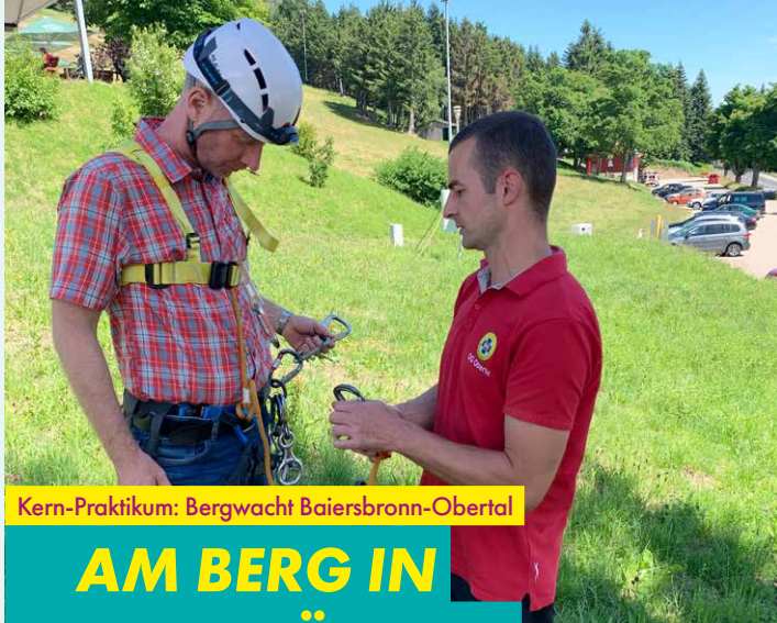
Kern-Praktikum: Bergwacht Baiersbronn-Obertal