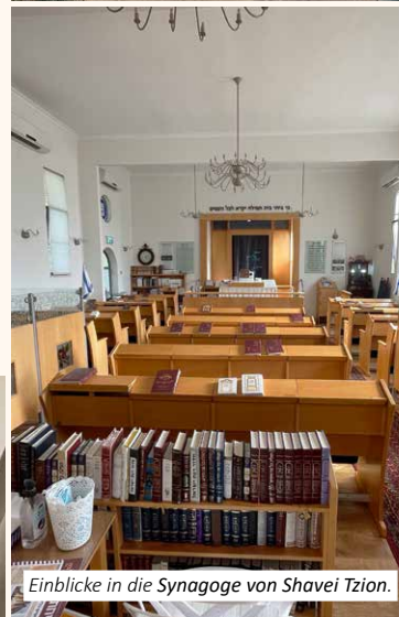
Einblicke in die Synagoge von Shavei Zion.

Shavei Zion ist ein Dorf an der nördlichen Mittelmeerküste Israels, das eine sehr enge histo- rische Beziehung zu Rexingen, einem Stadtteil von Horb am Neckar, besitzt. Über mehrere Jahrhunderte hinweg lebte hier eine der angesehensten und bedeutendsten südwestdeutschen Landjudengemeinden. Unter der zunehmenden Bedrohung durch die nationalsozialistischen Entwicklungen in Deutschland konnte eine erste Gruppe von Rexinger Juden bereits 1938 die genossenschaftlich organisierte Turm- und-Palisaden-Siedlung Shavei Zion in Palästina gründen und damit dem Holo- caust entkommen. Mehr Informationen gibt es auch unter: